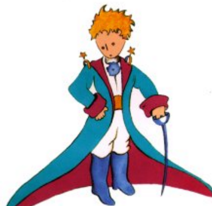
Aquí tienen el mejor retrato que más tarde logré hacer de él

Me puse en pie de un salto como herido por el rayo. Me froté los ojos. Miré a mi alrededor. Vi a un extraordinario muchachito que me miraba gravemente. Ahí tienen el mejor retrato que más tarde logré hacer de él, aunque mi dibujo, ciertamente es menos encantador que el modelo. Pero no es mía la culpa. Las personas mayores me desanimaron de mi carrera de pintor a la edad de seis años y no había aprendido a dibujar otra cosa que boas cerradas y boas abiertas.