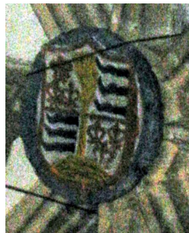
Fig.5: Escudo central