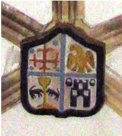
Fig.6: Clave 1