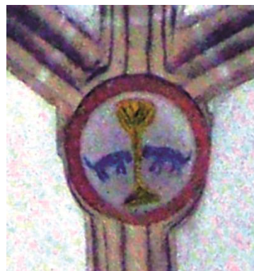
Fig.9: Clave 4