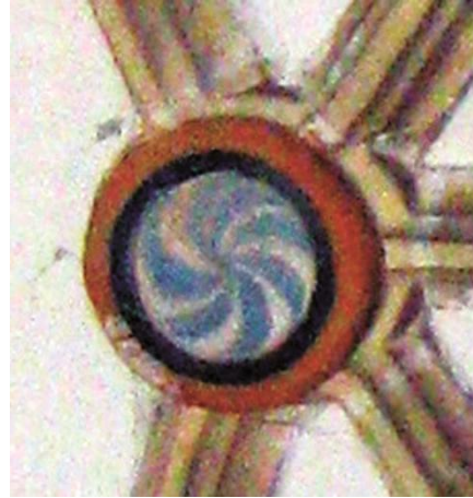
Fig.13: Clave 8