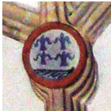
Fig.11: Clave 6