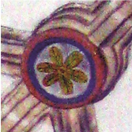
Fig.13: Clave 7