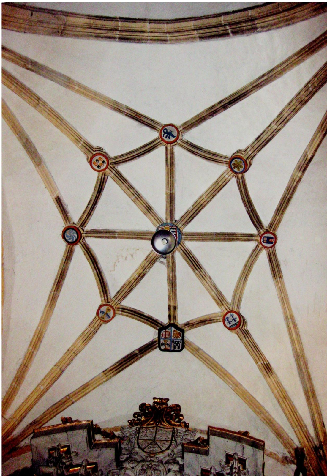
Fig. 2: Bóveda de la capilla de San Juan en la iglesia parroquial de la Asunción de Novalles, en la actualidad