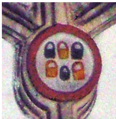
Fig.8: Clave 3