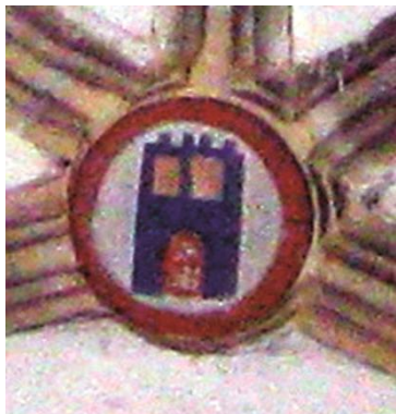
Fig.10: Clave 5

En esta clave aparecen, en campo de plata, cuatro flores de lis de azur y en punta ondas de mar, también de azur. Es difícil saber qué armas representa este escudo. En algunas piezas armeras de la casa de Isla en Novales aparecen algunas lises junto a la cruz. También aparecen lises en las armas de Velarde, Quijano y Gómez del Corro, por lo que quizá represente esta clave un compendio de todos los linajes emparentados con esta casa de Isla. La flor de lis es uno de los elementos heráldicos que más representaciones tiene en la heráldica de Cantabria junto con las torres y castillos.