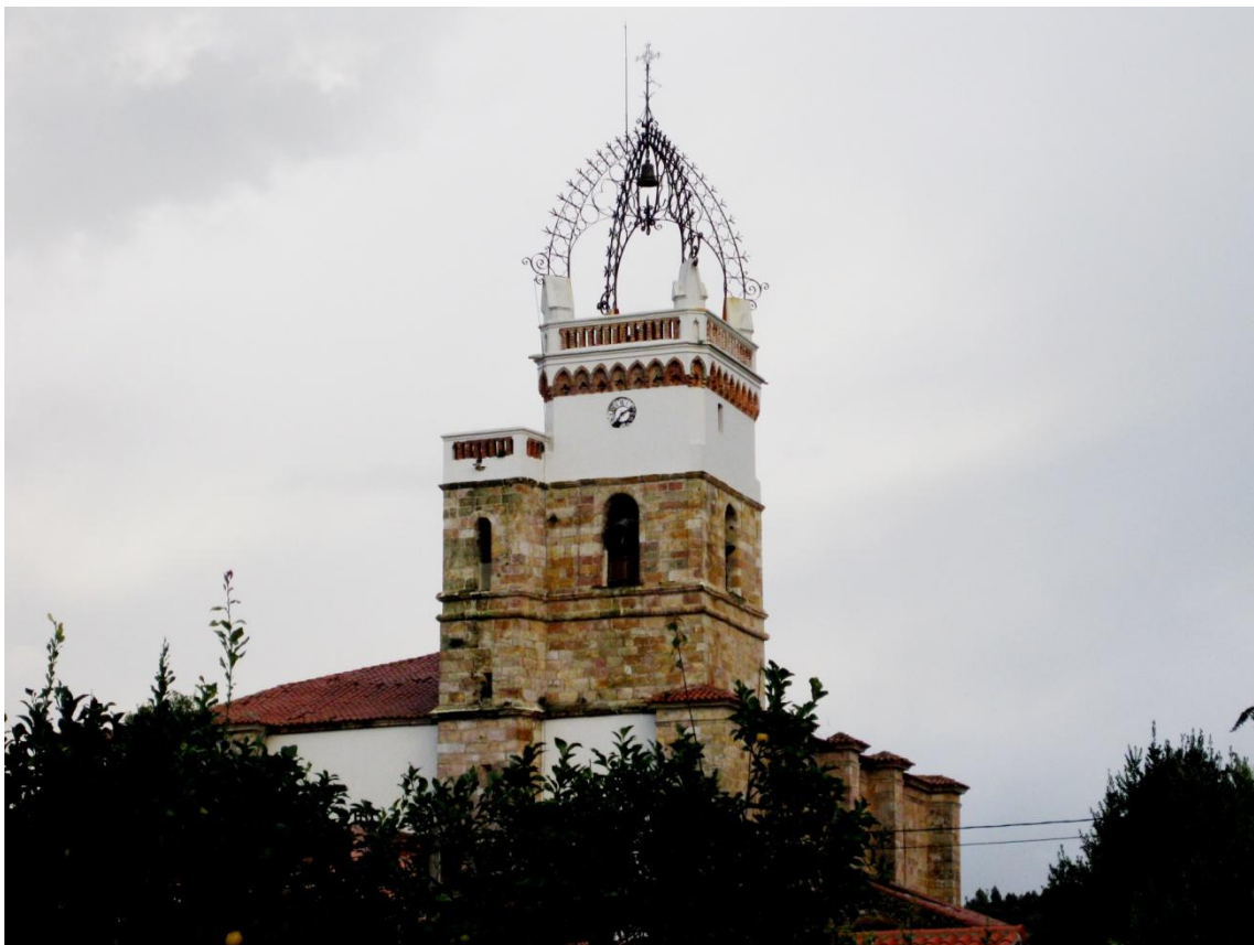
Fig. 1- Iglesia parroquial de la Asunción de Santa María del lugar de Novales.

Novales, población perteneciente al municipio de Alfoz de Lloredo y cabeza del mismo, cuenta con una iglesia parroquial dedicada a la Asunción Santa María ( Fig.1 ). En su puerta de entrada consta la fecha de 1574, posiblemente momento en que se finaliza la fábrica de dicha iglesia.