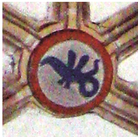
Fig. 7: Clave 2

El dragón es un elemento imprescindible en las representaciones del linaje de Velarde, tanto en los lugares donde aparecen sus armas cuarteladas y manteladas, como cuando sólo aparece un único campo. En esta clave se representan las armas de María Fernández Velarde, mencionada en el anterior escudo.