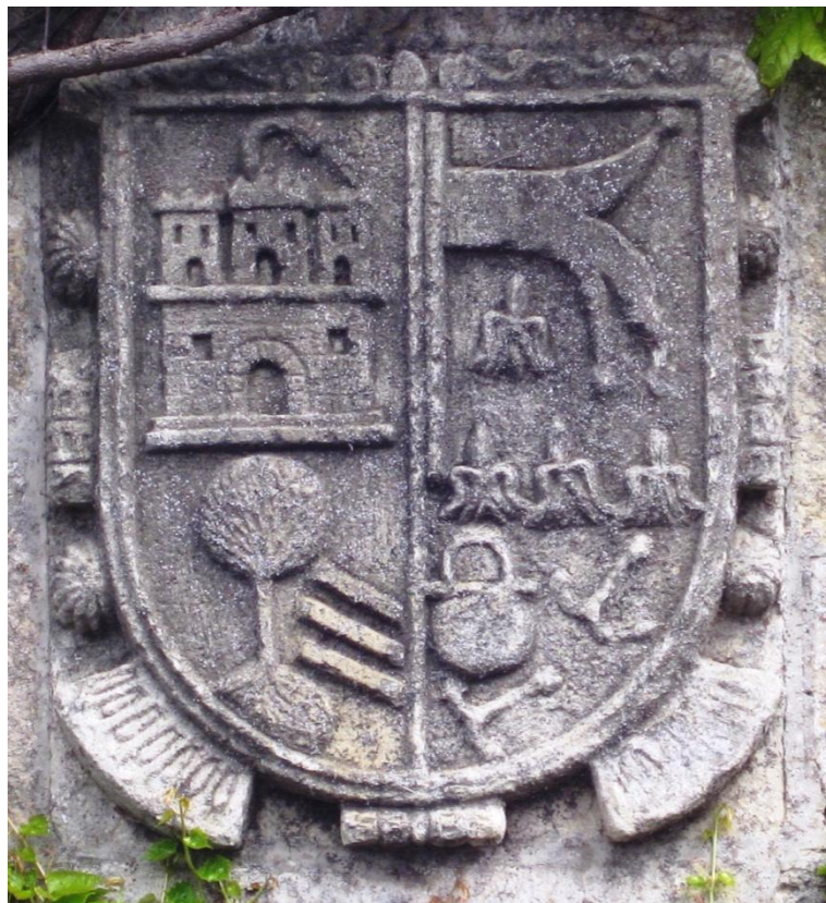
Armas de "Núñez de Quevedo" en Arenas de Iguña

En el lugar de Arenas, perteneciente al valle cántabro de Iguña, nos encontramos con varios solares correspondientes a distintos miembros del linaje de Núñez. Se encuentran instalados en el valle desde fechas inmemoriales y ya en el siglo XVI se distinguen los Núñez de Quevedo, los Núñez de Bustamante, los Núñez de Quijano, etc.