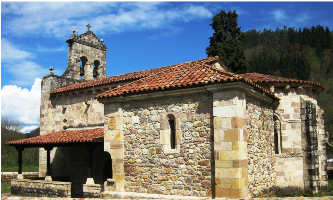
Fig. 1 Iglesia de San Juan de Raicedo