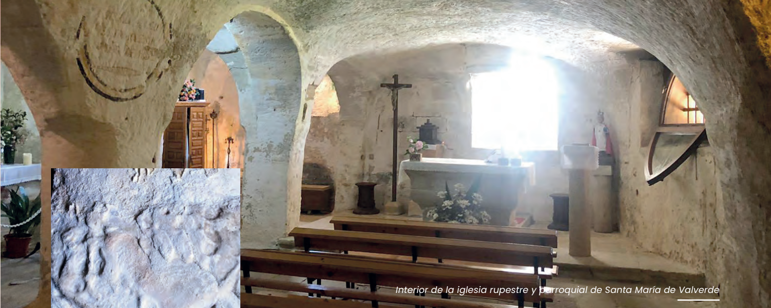
Interior de la iglesia rupestre y parroquial de Santa María de Valverde