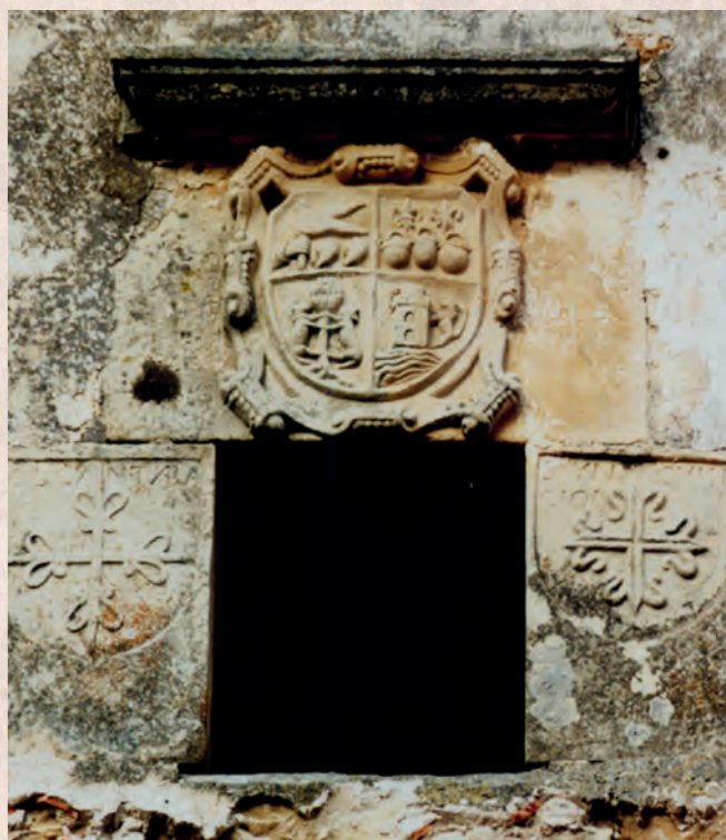
Armas de Navamuel, de la orden de Alcántara y del Santo Oficio en la torre de Castrillo de Valdelomar