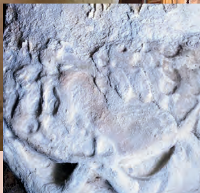
Armas de Navamuel en Castrillo de Valdelomar