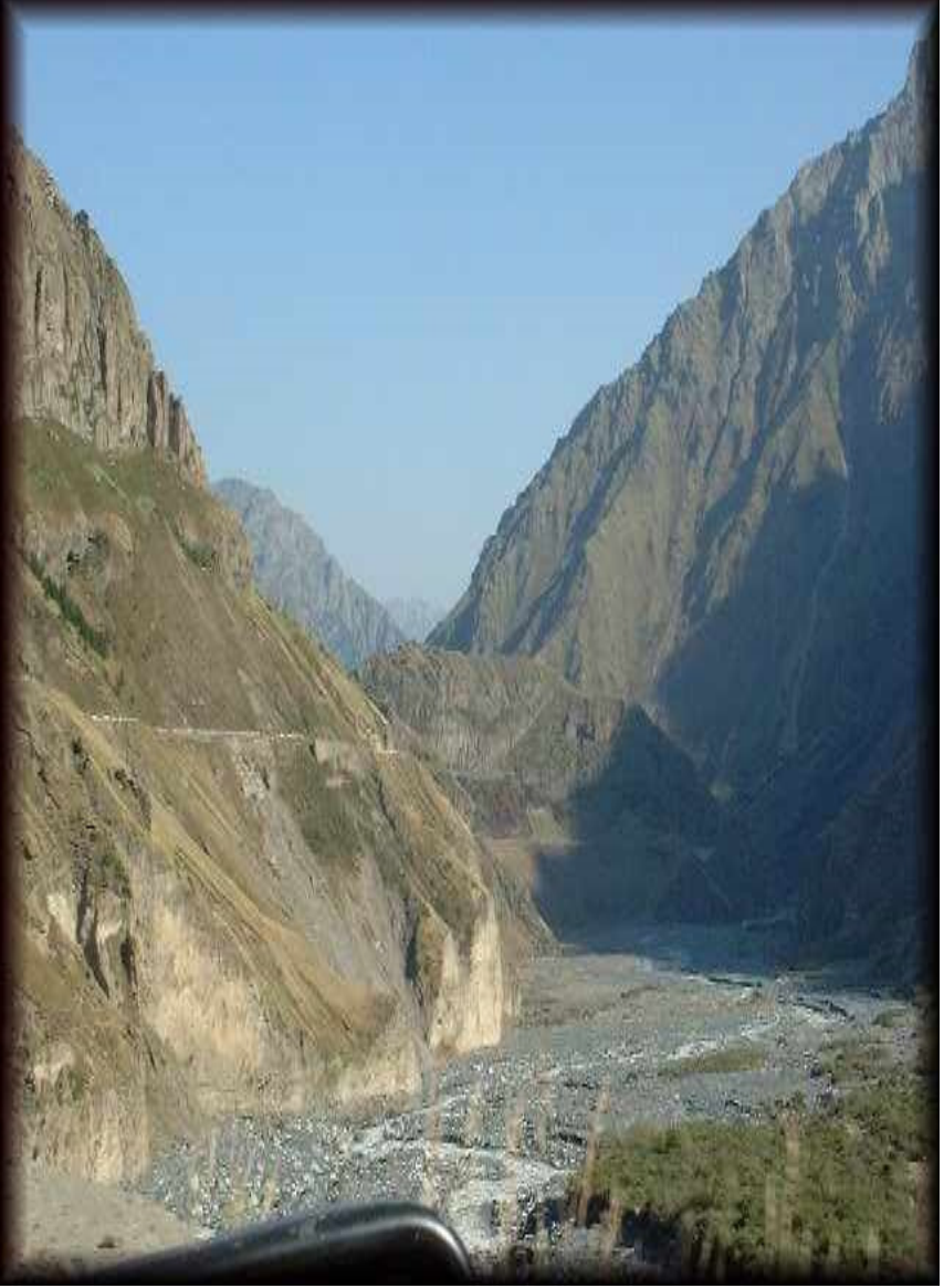
২ নং চিত্র: এখানেও গিরিখাতটিতে শামুকের দুই অংশের মত দেখা যাচ্ছে