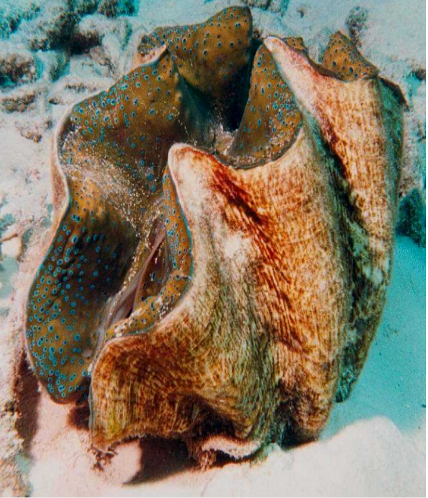
একটি খোলা শামুকের ছবি যেখানে এর সাদাফাইন দু'টি দেখা যাচ্ছে

এখানে উন্মুক্ত খোলসের আরো একটি ছবি রয়েছে যা এর সাদাফাইন الصدفين আকৃতিকে ফুটিয়ে তুলছে অর্থাৎ দুই পাশ নিচ দিয়ে আটকানো এবং উপরের কাটা অংশ পৃথক। এরপর আরো দু'টি ছবি রয়েছে যেটা অত্যন্ত পরিষ্কারভাবে গিরিখাতের সাদাফাইন الصدفين অথবা খোলস আকৃতিকে তুলে ধরছে: