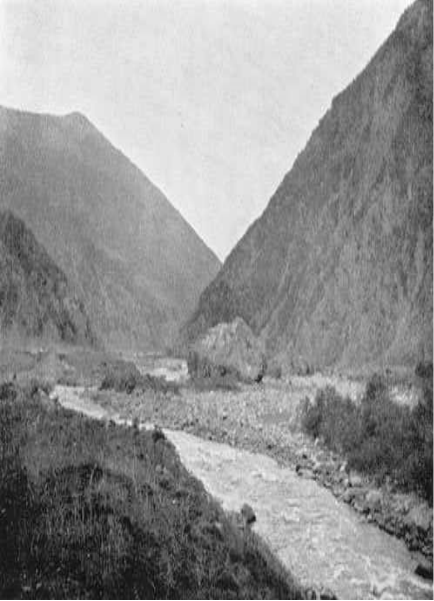
৩ নং চিত্র: আরও দূর থেকে নেয়া একটি চিত্র