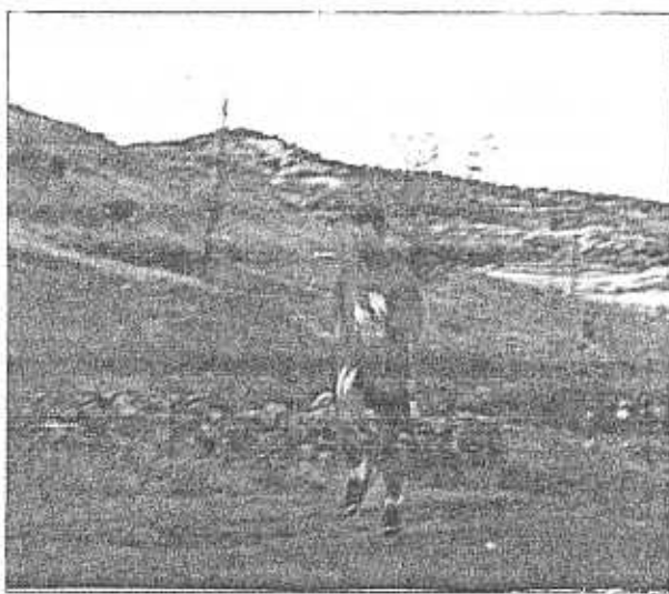
No hay quien pare a este líder, que va a velocidad de vértigo hacia la consecución del título.