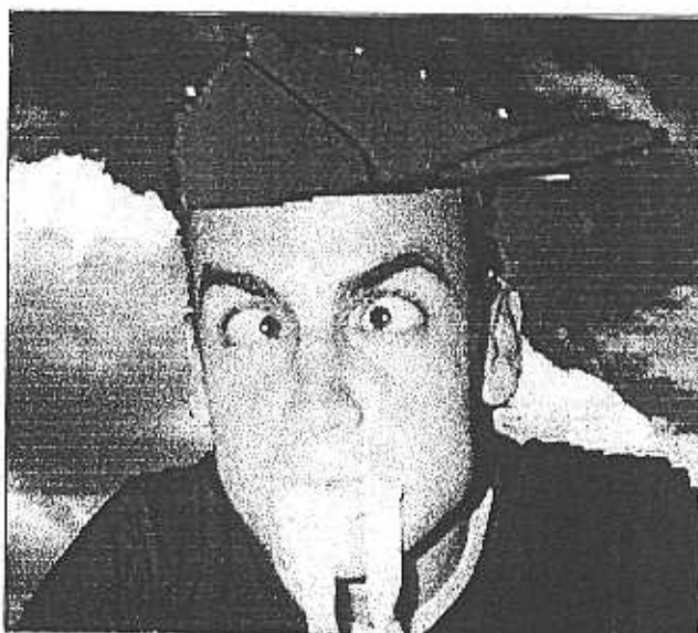
Mazo no encajó bien su primera derrota y estuvo al borde del colapso al término del partido.

pista 7 de la "Vall d'Hebrón" era un auténtico polvorín. Prácticamente estaba en juego el título en