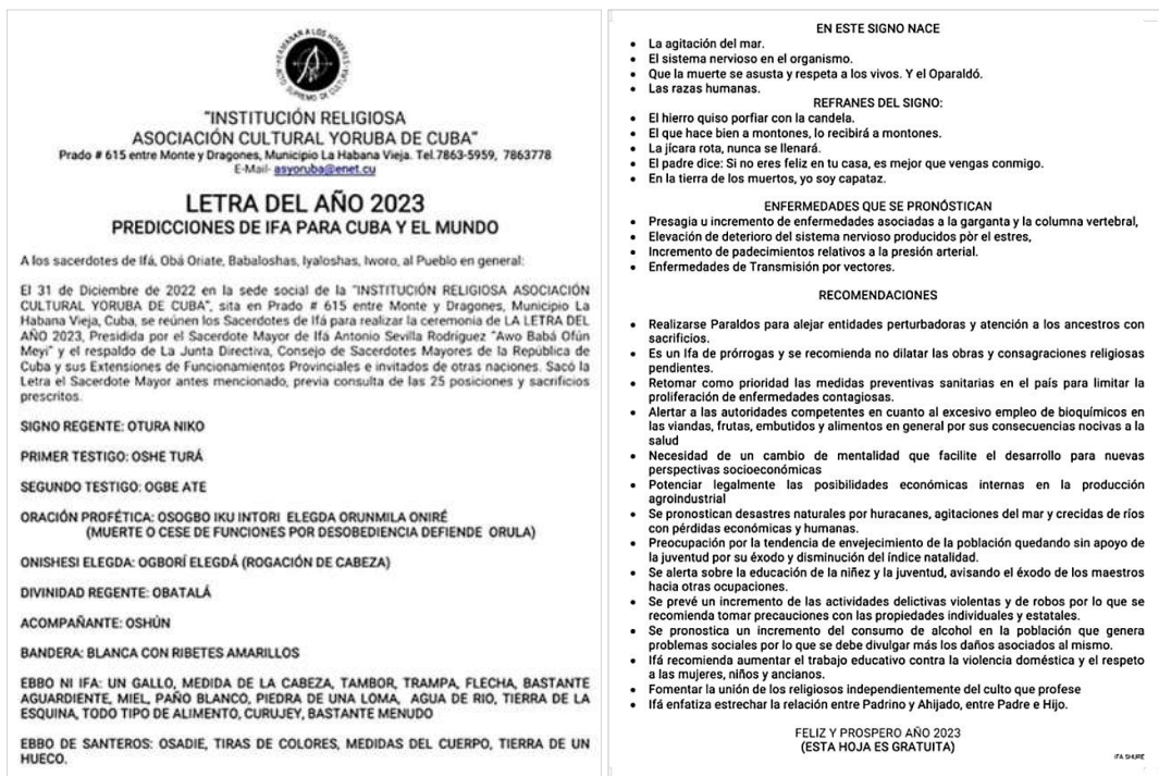
Figura 2. La letra del año. Predicciones religiosas para Cuba y el mundo.

MIQUEAS 3:7 - Y serán avergonzados los profetas, y se confundirán los adivinos; y todos ellos se cubrirán los labios, porque no hay respuesta de Dios.