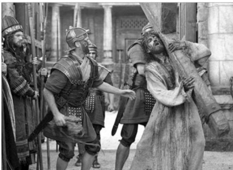
Fotograma de 'La Pasión,' de Mel Gibson. El actor-director acomete con riesgo su tercera película.