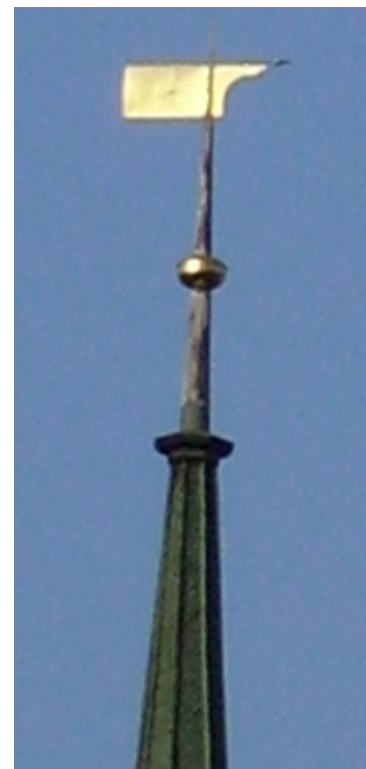
Die Kirchturmspitze im Abendlicht (Bild des Verfassers, 24. September 2006, 18 Uhr)

Es folgt die Baugeschichte der jüngsten Restaurierung: «Am 25. November 1965 stimmte die Kirchgemeindeversammlung dem [...] Projekt zu & bewilligte zugleich den erforderlichen Kredit von 677'000.-. Nach der Einführung des kirchl. Frauenstimmrechtes durch das seit 1964 in Kraft stehende „Gesetz über die evang.-reform. Landeskirche des Kt. Zürich“, waren an diesem Beschluss erstmals nun auch unsere weiblichen Kirchgemeindeglieder mitbeteiligt. Die weitem nun folgenden Vorbereitungsarbeiten durch die 11-gliedrige Baukommission dauerten, unter Mitraten der kant. und eidg. Denkmalpflege, bis zum Herbst 1966. Am 9. Oktober 66 fand der letzte Got-