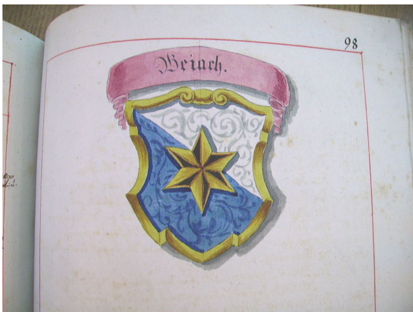
Blatt 98 des Acten- und Decanats-Buch Eines Ehrwürd. Regensberger Capituls , erstellt 1719.

Unter den Wappen der übrigen Gemeinden des Kapitels stehen diverse Einträge. Von Weiach findet man nur das Wappen. Warum das? Nach der Reformation gehörte die Kirchgemeinde Weiach fast zwei Jahrhunderte zum Regensberger Kapitel. Im Jahre 1651 gelangte der grösste Teil des Rafzerfeldes endgültig unter die Kontrolle des Zürcher Stadtstaates. Damit wurde das Regensberger Kapitel wohl zu gross. Im Jahr 1712 wurden jedenfalls die Gebiete am Rhein abgespalten. Mit zum neuen Eglisauer Kapitel gehörten neben Weiach und den Gemeinden des Rafzerfelds auch die von Zürcher Pfarrern betreuten Gemeinden Tegerfelden und Zurzach im heutigen Kanton Aargau. Das Weiacher Wappen ist also eine Art Erinnerung an frühere Zeiten. Erst mit der neuen Verfassung von 1831 wechselte Weiach wieder ins Pfarrkapitel Regensberg.