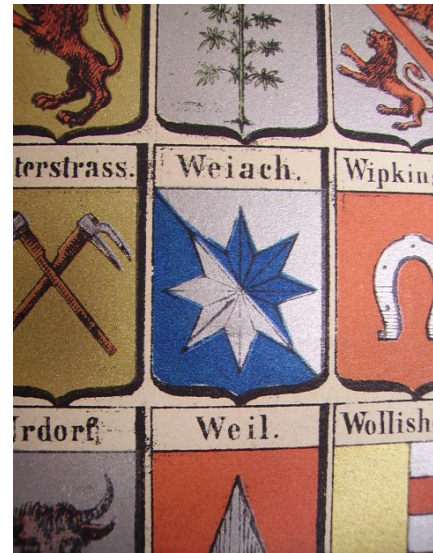
Ausschnitt aus der Wappentafel von Krauer (um 1860)

So berichtet Zollinger in der Umfrage von 1925, das Wappen auf der Schützenverein-Fahne von 1902 sei «genau nach Krauer» gestaltet. Ebenso eine Wappenscheibe im Sitzungszimmer des Gemeinderates. Weiter befindet sich auf einer Bürgerrechtsverleihung vom Jahr 1919 ebenfalls das Krauer'sche Wappen. Der achtstrahlige Stern hatte also im Bewusstsein der Weiacher den sechsstrahligen erfolgreich verdrängt.