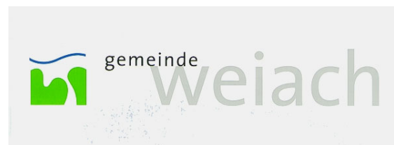
Das neue Logo der Gemeinde Weiach aus dem Jahre 2000 – nicht zu verwechseln mit dem seit dem 1931 offiziellen Gemeinde-Wappen.

Die Geschichte zeigt auch bei den Wappen, dass nichts beständiger ist als die Veränderung: