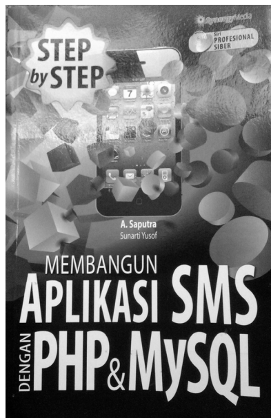
Gambar 2.2 Cover buku dalam edisi Bahasa Melayu (Malaysia)

Sedangkan satu cover lagi dalam edisi bahasa Melayu (Malaysia).