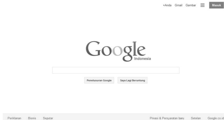
Gambar 1.2 Website Google.com – Kesederhanaan dan kaya fitur membuat mesin pencari ini disukai banyak orang

Jika anda ingin populer di kalangan banyak orang dan mempertahankan keberadaan online (online existance), maka jadilah populer di Google.