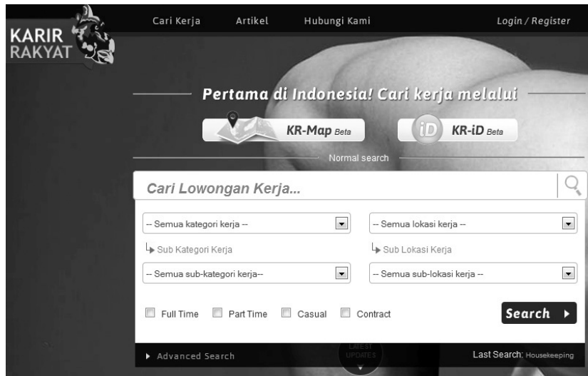
Gambar 1.5 Situs pencari kerja yang merakyat http://www.karirakyat.com/

Situs pencari kerja karirakyat.com mengklaim sebagai situs pencari lowongan kerja yang merakyat, tidak soal apapun itu jenis pekerjaannya, ragam pekerjaan dapat ditemukan seperti misalnya: supir, SPG, pembantu rumah tangga, hingga profesional. Dapat disimpulkan, jika Anda melakukan pencarian kerja online, maka eksistensi online harus terlihat, tidak soal profesi Anda!