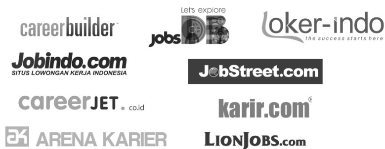
Gambar 1.4 Ragam situs pencari kerja – Secara tidak langsung eksistensi online Anda dipaksa muncul

Selembbar CV tidak mampu bercerita seindah halaman web perihal siapa Anda, maka tidak heran jika para pencari kerja sengaja menyisipkan website mereka untuk dilihat oleh si pewawancara atau staff rekrutasi. Tapi buku ini akan memberikan mereka lebih lagi, karena Anda populer! Buku ini akan membuat Anda populer.