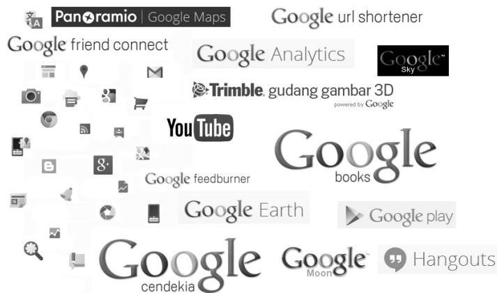
Gambar 1.3 Berbagai produk Google

Jika anda ingin populer di kalangan banyak orang dan mempertahankan keberadaan online (online existance), maka jadilah populer di Google.