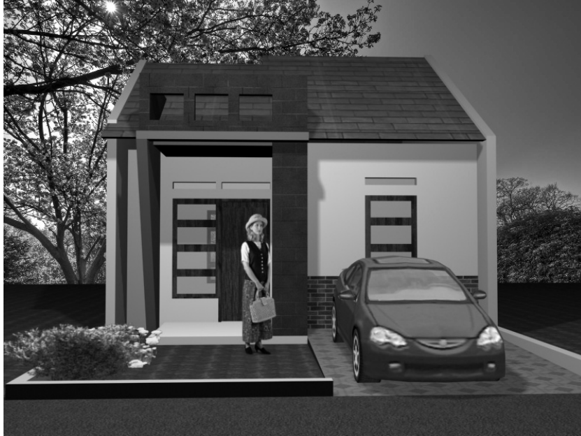
Gambar 6.13 Tampak depan desain 3D rumah minimalis

Pada tampilan depan rumah, terlihat konsep rumah ini mengambil konsep tropis minimalis. Hal ini terlihat dari penggunaan masa kotak secara horizontal dan vertikal. Pada area depan, terdapat bukaan berupa jendela dan pintu yang cukup banyak. Hal ini bagus untuk mengontrol udara di dalam rumah agar tetap sejuk dan nyaman. Rumah ini sangat cocok dan pas untuk keluarga dengan anggota keluarga yang masih sedikit, sehingga mampu menampung segala aktivitas masing-masing anggota keluarga.