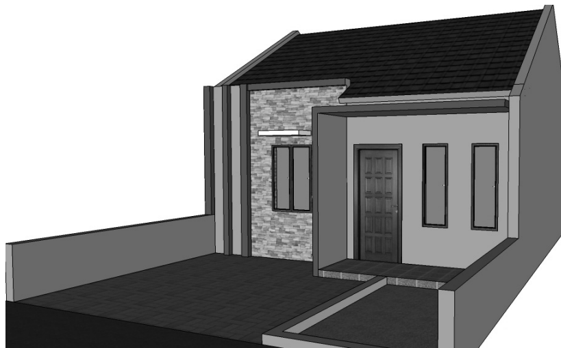
Gambar 6.6 Tampilan perspektif kiri rumah