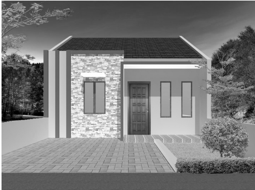
Gambar 6.4 Tampak depan desain 3D rumah minimalis

Pada area depan rumah, terdapat beberapa bukaan jendela dan bukaan pintu yang berguna untuk sirkulasi agar udara di dalam rumah bisa dikontrol dengan baik.