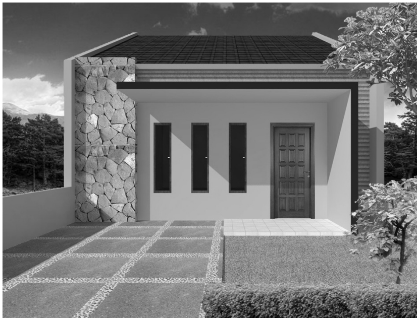
Gambar 6.1 Tampak depan desain 3D rumah minimalis