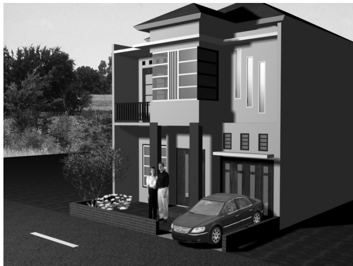
Gambar 6.12 Tampilan perspektif kiri rumah