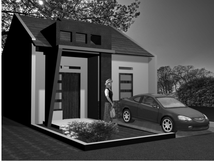
Gambar 6.14 Tampilan perspektif kanan rumah