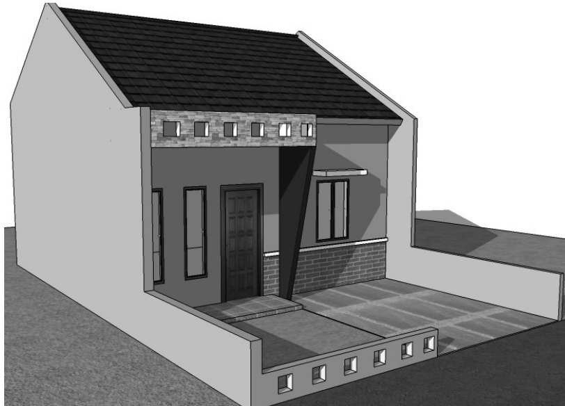
Gambar 6.8 Tampilan perspektif kanan rumah