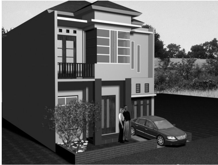
Gambar 6.11 Tampilan perspektif kanan rumah