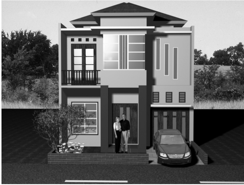
Gambar 6.10 Tampak depan desain 3D rumah minimalis

Tampak desain rumah ini sangat cantik dan menawan. Pada tampak desain rumah ini terlihat banyaknya bukaan berupa jendela besar dan kecil, selain itu ada bukaan pintu pada lantai satu dan dua. Pada area depan rumah terdapat carport dan area taman yang berguna untuk tempat parkir kendaraan pribadi dan menanam tanaman berupa bunga dan tanaman lainnya. Posisi taman pada area depan berguna untuk menyaring udara kotor agar tidak masuk ke dalam rumah.