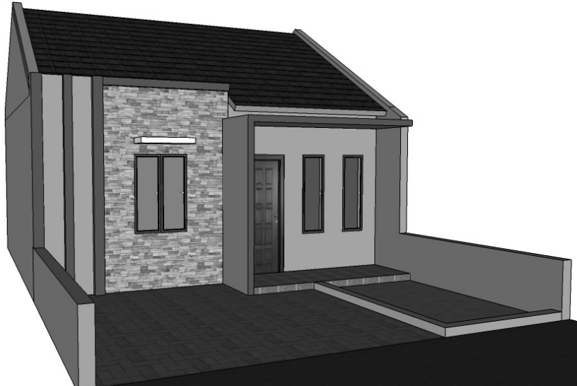
Gambar 6.5 Tampilan perspektif kanan rumah