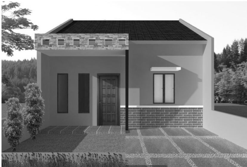
Gambar 6.7 Tampak depan desain 3D rumah minimalis

Tampilan desain 3D rumah ini cukup menarik dan memberikan nuansa hangat pada tampilan desain rumah. Ada beberapa bukaan jendela pada dinding sisi kiri dan kanan rumah. Tiang-tiang dak teras pada area teras rumah memberi kesan kokoh dan menambah menarik tampilan desain rumah. Pada area depan terdapat taman rumah yang berfungsi untuk menyaring udara kotor agar tidak langsung masuk ke dalam rumah.