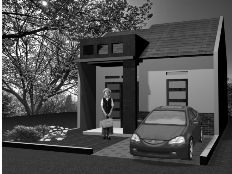
Gambar 6.15 Tampilan perspektif kiri rumah