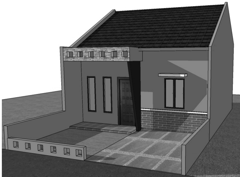
Gambar 6.9 Tampilan perspektif kiri rumah